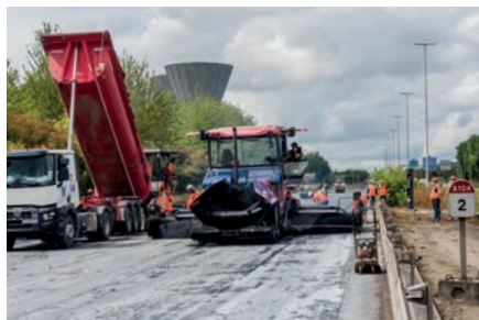
Rénovation des chaussées avec un enrobé à fort taux de recyclage