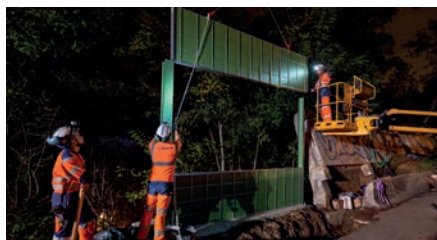
Pose d'écrans phoniques à Bièvres

Budget de l'opération : 11 millions d'euros dont 2,3 millions cet été