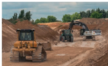
Travaux de terrassement de la future A104 au Mesnil-Amelot.

Un itinéraire de déviation sera mis en place.