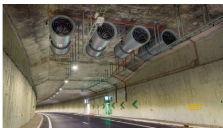
Système de ventilation installé dans les tunnels (tunnel de Boissy)

Budget de l'opération : 30,5 millions d'euros dont 2 millions cet été