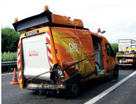
Véhicules percutés lors d'une intervention